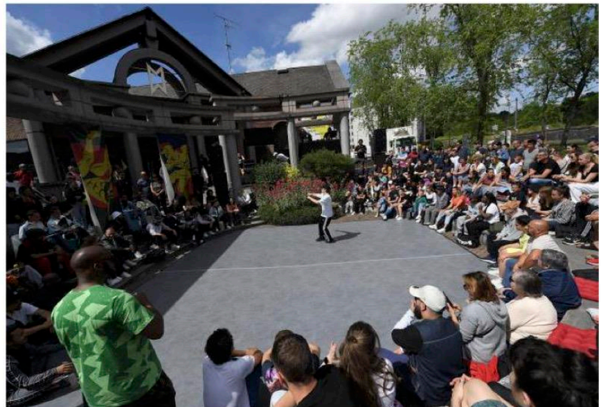
La deuxième édition du festival Itak propose une programmation à budget constant.

Et comme partout ailleurs, la culture n'échappe pas à l'inflation des énergies, il est aussi question cette année de réunir les forces. Le Manège, Le Phénix à Valenciennes, Mars Mons et le théâtre de Charleroi s'associent, à l'heure où il est important d'avoir une stratégie économique pour continuer à offrir une programmation à budget constant. On oublie les féodalités qui ont pu exister pour « être aussi ensemble financièrement ». Intelligent.