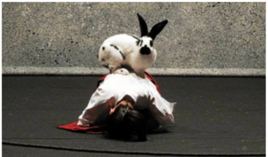
Amstrong et Haruka dansent sur la scène.