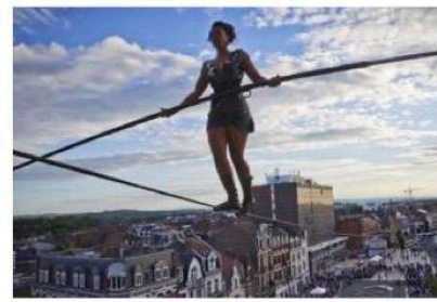
La funambule de la compagnie Basinga avait réalisé une traversée incroyable, à Lens, en 2019.

Du 16 au 27 mai, à Maubeuge, place Roosevelt, en face du zoo.